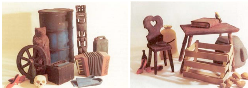
Stilleben , 1982, Polyurethan bemalt.

Der Raum ohne Titel wurde von der Walter A. Bechtler-Stiftung angekauft, die sich für zeitgenössische Kunst im öffentlichen Raum engagiert. Fischli/Weiss richteten ihn 1992 anlässlich der Ausstellung Platzverführung in Stuttgart-Schorndorf wiederum in einer Garage ein sowie im Rahmen der Ausstellung Doubletake in der Hayward Gallery in London. Im Anschluss daran war er im ehemaligen Zürcher Industriequartier angesiedelt: bis 1996 in einem alten Gebäude an der Hardturmstrasse, wo er bis 2 Uhr nachts beleuchtet und vom Trottoir aus durch ein Fenster einsehbar war, danach im Innern des Löwenbräuareals an der Limmatstrasse 270. Im Kontext von renommierten Kunsthallen und Galerien funktionierte der unscheinbare Raum als kritische Randbemerkung zum Kunstbetrieb. Flankiert von ganz ähnlichen echten, jedoch verschlossenen Rumpelkammern zeigte er das, was Museumsbesuchern normalerweise vorenthalten wird. 6 Seit 2003 nun befindet sich der Raum ohne Titel in einer ehemaligen Feuerwehrgarage bei der Bushaltestelle Somvih am westlichen Dorfausgang von S-chanf.