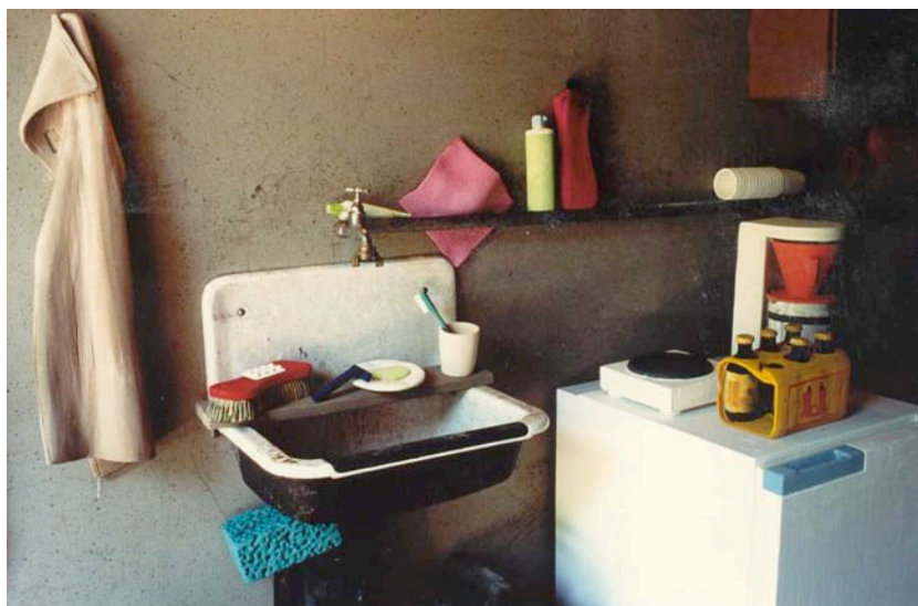
Raum ohne Titel , 1991, Cham, Polyurethan bemalt.