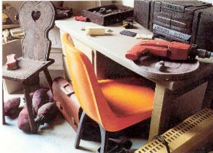
Raum ohne Titel , 1991, Hardturmstrasse, Zürich, Polyurethan bemalt.

Um den Raum ohne Titel des international bekannten Künstlerduos Peter Fischli/David Weiss beim westlichen Dorfausgang von S-chanf zu entdecken, muss man aufmerksam sein. Denn kein Schild, nichts weist auf das Kunstwerk hin, das sich unvermittelt in der ausgedienten Feuerwehrgarage bei der Bushaltestelle Somvih befindet. Einzig ein rechteckiges Fenster in einer der grossen Türen gewährt Einblick in den schwach beleuchteten Raum.